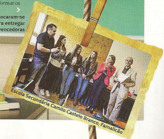
Escola Secundária Camilo Castelo Branco, Famalicão