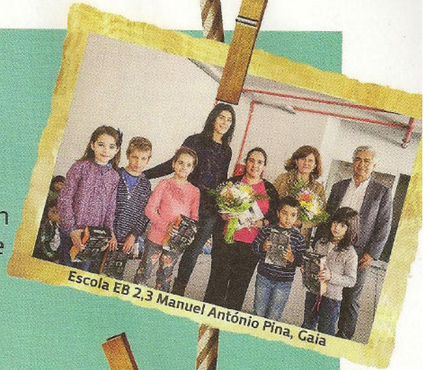
Escola EB 2,3 Manuel António Pina, Gaia

Os representantes da DECO deslocaram-se a Gaia, Portimão e Famalicão para entregar os prémios às equipas vencedoras